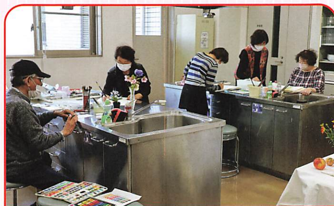
水彩画サークル (第1・3土曜日)