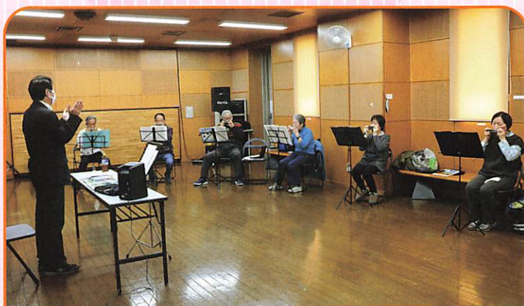
戸田ハーモナイズ (第1・3火曜日)