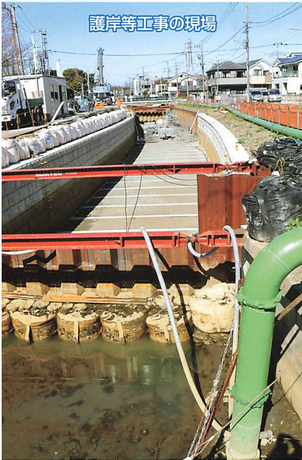
護岸等工事の現場

笹目地区の名所のひとつで市内随一の桜並木を誇るさくら川。今、その改修工事が着々と進められています。