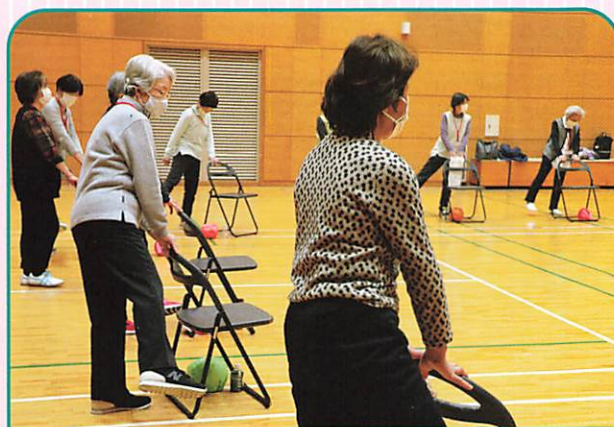
サークルコスモス (第1・3水曜日) 【いきいき体操】