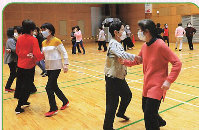
美笹フォークダンス (第1・3月曜日)

参加者は、朝、自宅で体温測定や健康状態をチェックし、心配のときは無理をしないで休みましょう。