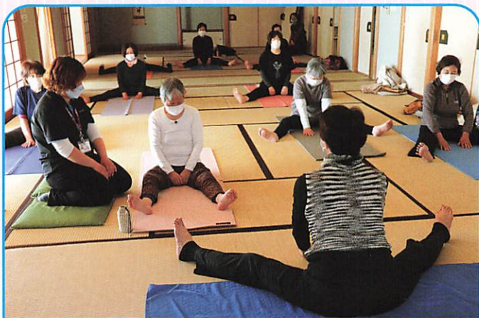
ゆるりヨーガ (毎週水曜日)