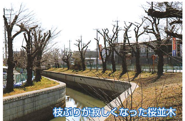
枝ぶりが寂しくなった桜並木

また、他の場所でも枝ぶりを切り落とした姿が見られます。現在の桜木は植栽から約半世紀を経て大分傷んでいます。さくら川に桜並木が必要なのは自明のこと。有名な都内の目黒川同様、笹目川が広く知られる名所になるよう期待されます。