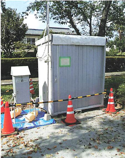
早瀬公園に設置された観測所 季節に7日間のみ設置される