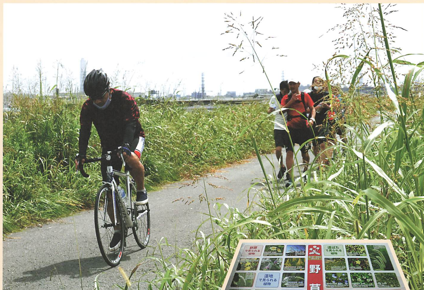
彩湖南端にある「野草」表示 ▶