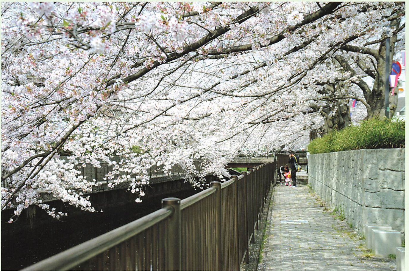
さくら川聖橋～早瀬橋の親水園路にて