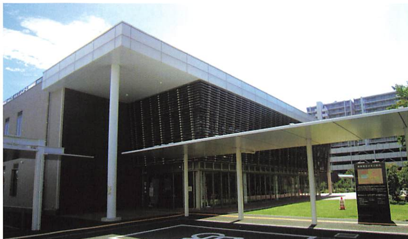
戸田市福祉保健センター

新型コロナワクチンの接種がスタートすることに対応して、市は1月6日に「新型コロナウイルスワクチン接種対策室」を設置し、1月18日から市福祉保健センター内で業務を開始しました。