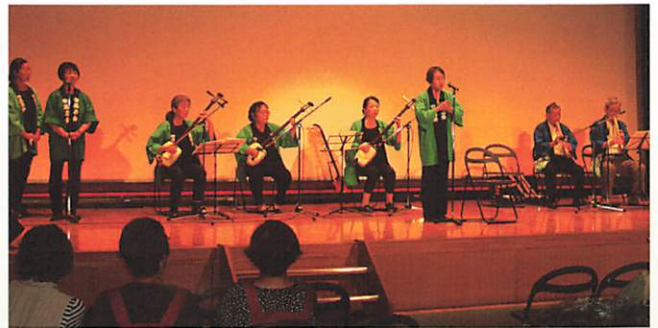
心を揺さぶる民謡の数々