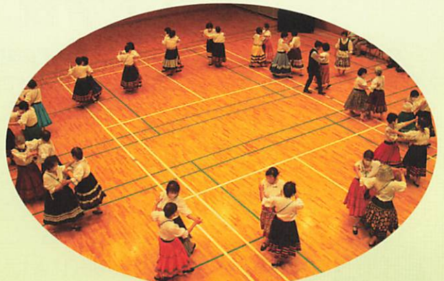
まつりの最後はみんなで大きな輪で踊ります