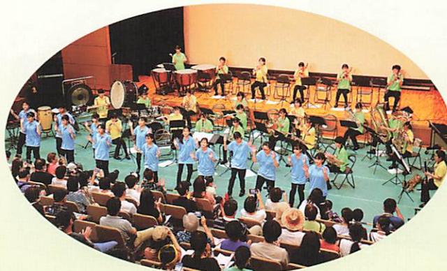
全員で元気に！笹目中吹奏楽部