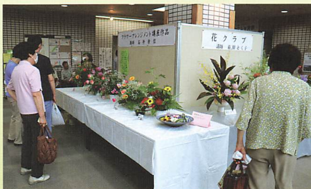
華やかなフラワーアレンジメント