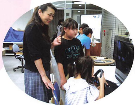
楽しく一緒にシミュレーションゲーム