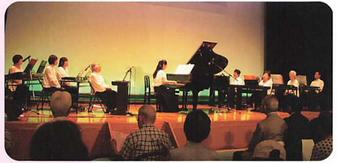
幕開けは優雅に強くピアノ演奏

コンパル全体が智恵を出し合い、協力しあいながら開催された2日間。姉妹都市の野菜、海産物の販売も復活し、各会場からは子どもたちの元気な声や、久しぶりの再会を喜び合う人たちの姿がたくさん見られました。