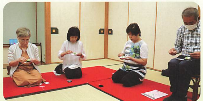
おいしいお菓子とお抹茶をいただきました